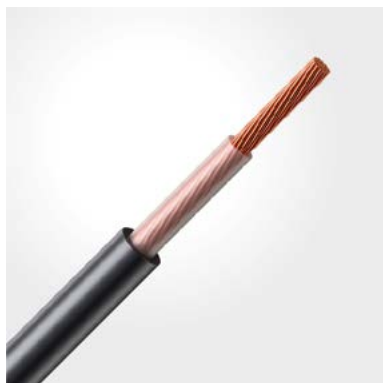
Нормативная документация ТУ 16-705.077-79