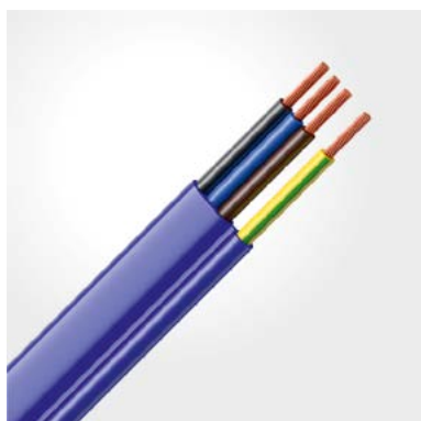
Нормативная документация ТУ 16.К13-035-2004