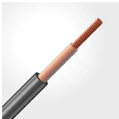
Нормативная документация ТУ 16.К13-029-2002