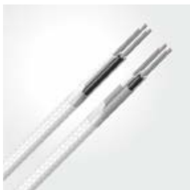
Нормативная документация ТУ 16-505.754-75

Кабели многожильные с полиэтиленовой изоляцией, оплетенные, малогабаритные