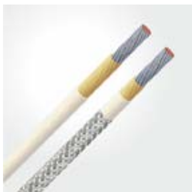
Нормативная документация ТУ16-505.941-76

Провода бортовые облуженные с двухслойной изоляцией